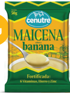
Banana 50g (1.7oz. – 0.1 libra)