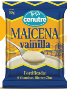
Vainilla 50g (1.7oz. – 0.1 libra)