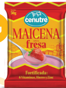
Fresa 50g (1.7oz. – 0.1 libra)