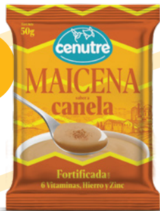
Canela 50g (1.7oz. – 0.1 libra)